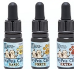
Aceite de Cáñamo CBD Mascotas CBD Pets 2% - 5% - 10% 10 ml y 30 ml