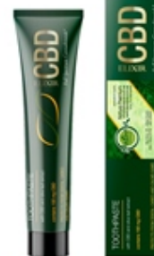
Pasta de Dientes CBD CBD Toothpaste