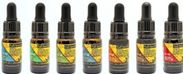
Aceite de Cáñamo CBD 2% - 5% - 10% - 15% - 20% - 30% - 40% 10 ml y 30 ml CBD OIL FULL SPECTRUM