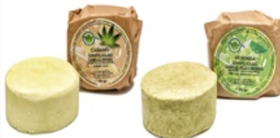
Champú de Cáñamo Cabello graso Hemp Shampoo Greasy Hair