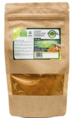
Cúrcuma Longa Turmeric 125 y 500 grs