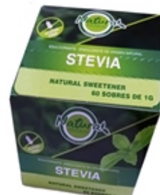
Monodosis (Azucarillos) 60 uds Monodose (Sugars) 60 units

STEVIA REBAUDIANA BERTONI ECOLÓGICA: Hoja Entera y Hoja Molida para diabéticos. Hipertensión. Antioxidante. hipertensas. Bactericida. Previene la caries. Combate ciertos hongos, como el Cándida Albicans. Diurético. Antiácido y facilita la digestión. Combate la fatiga, la ansiedad, gripes y resfriados. Cicatrizante. Bactericida