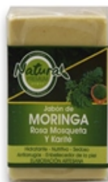
Jabón de Moringa Moringa Soap