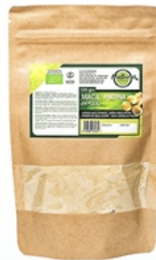
Maca Andina Andean Maca 125 y 500 grs