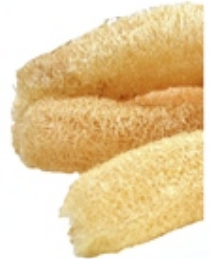
Espanja de Lufa Loofah Sponge