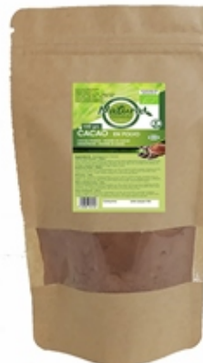
Cacao en Polvo Cocoa Powder 100 y 400 grs