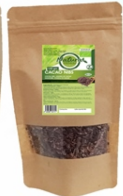
Cacao NIBS Cocoa NIBS 120 grs