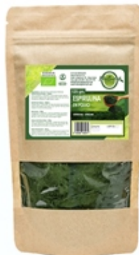
Espirulina Spirulina 125 y 500 grs