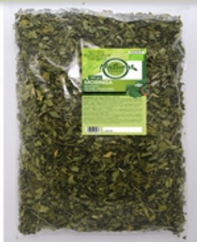
Hoja de Moringa - Envase bolsa de plástico Moringa Leaf - Plastic Bag Container 100 grs, y 500 grs

ORGANIC MORINGA OLEÍFERA: Whole Leaf and Powdered Leaf. 10 times more vitamin A than carrots. 12 times more vitamin C than oranges. 15 times more potassium than bananas. 17 times more calcium than milk. 25 times more iron than spinach.