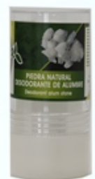
Desodorante Piedra de Alumbre Alum Stone Deodorant

www.naturapremium.es - info@naturapremium.es