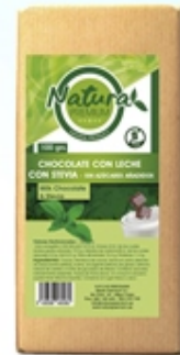
Con Leche With Milk