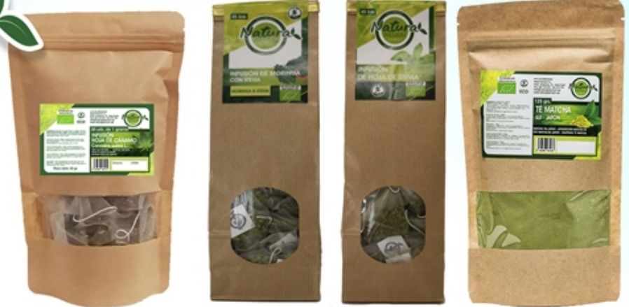
Infusión de Hoja de Cáñamo Hemp Leaf Infusion 30 uds. Infusión de Moringa con Stevia Moringa infusion with Stevia 20 uds y 45 uds Infusión de Stevia Stevia Infusion 20 uds y 45 uds Té Matcha Uji Uji Matcha Tea 30 grs y 125 grs