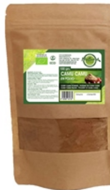
Camu Camu 100 grs