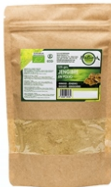
Jengibre Ginger 125 y 500 grs