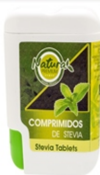
Comprimidos 300 uds Tablets 300 units