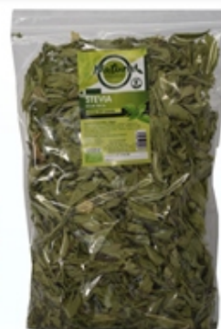
Hoja de Stevia - Stevia Leaf Envase bolsa de plástico 45 grs, 100 grs, 500 grs y 1000 grs