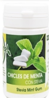
Chicles 50 uds Mint Gum