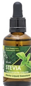
Stevia Líquida 50 ml y 250 ml