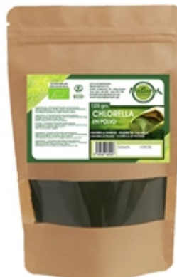
Chlorella 125 y 500 grs