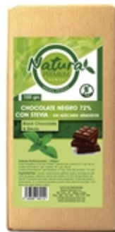
Negro 72% Black 72%