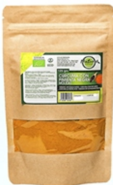
Cúrcuma/Pimienta Negra Turmeric/Black Pepper 125 grs