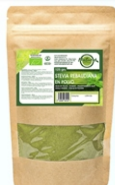
Hoja de Stevia Molida Ground Stevia Leaf Envase Doypack 125 grs y 500 grs

www.naturapremium.es - info@naturapremium.es