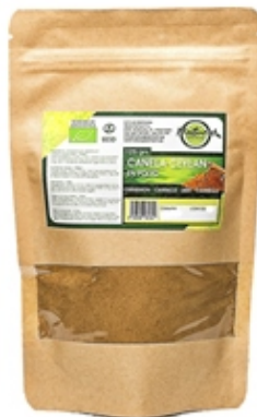
Canela Ceylan Cinnamon 125 y 400 grs