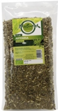
Artemisa Sagebrush 70 grs