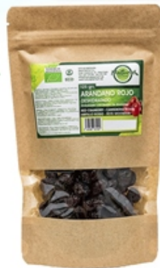
Arándano Rojo Red Cranberry 125 grs