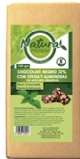
Negro 72% con Almendra Black 72% wuth Almond