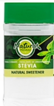
Endulzante 300 grs Sweetener 300 grams