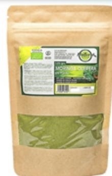
Hoja de Moringa Molida Ground Moringa Leaf Doypack 125 grs y 400 grs