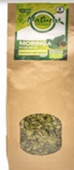
Hoja de Moringa - Envase papel Kraft Moringa Leaf - Kraft paper container 75 grs