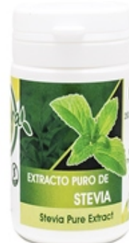
Extracto Puro - (Steviol) Pure Extract (Steviol) 8 grs y 25 grS