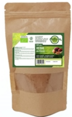
Reishi 100 grs

www.naturapremium.es - info@naturapremium.es Tfno +34 682169690 - +34 952479799 - Mijas Costa (Malaga)