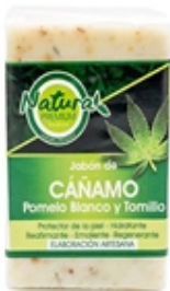
Jabón de Cáñamo Hemp Soap