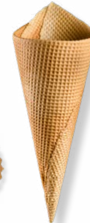
BARQUILLO ARTESANO AMERICANO Nº90 REF. 290

REF. 270: Envase: Bandeja/caja. Altura: 175 mm. Diámetro: 70 mm. Unidades por caja: 235. CAJAS POR PALÉ: 32 CADUCIDAD: 18 meses.