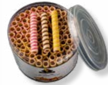
ROLLITO CORTO COLOR BOTE 460G REF. 201