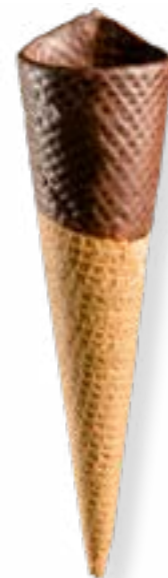
BARQUILLO Nº 45 CORONA DE CHOCOLATE REF. 5