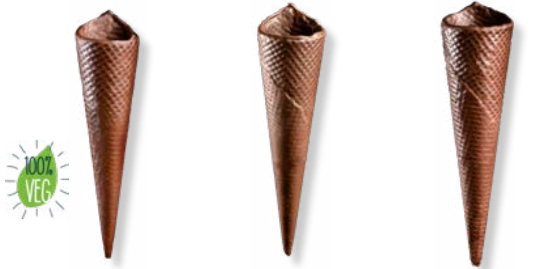
BARQUILLO Nº 40 CHOCOLATE NEGRO REF. 208