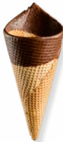
BARQUILLO ARTESANO AMERICANO Nº70 CORONA DE CHOCOLATE NEGRO REF. 70