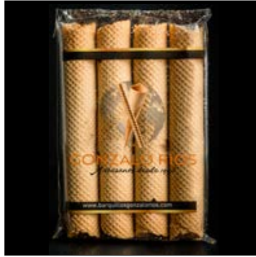
CUBANO REF. 207