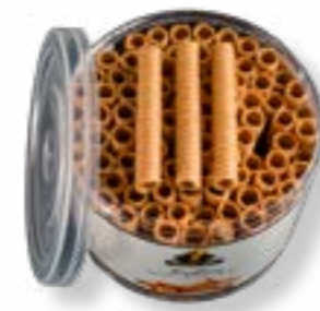
ROLLITO CORTO BOTE 320G REF. 69