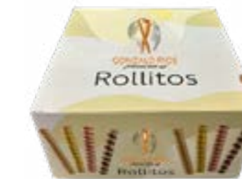
ROLLITO LARGO CAJA 750G REF. 19

Mezclado de ingredientes, distribución a máquinas de cocción, moldeado, enfriado, empaquetado y paletización.