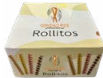
ROLLITO CORTO 750G REF. 20 ROLLITO CORTO COLOR 750G REF. 200