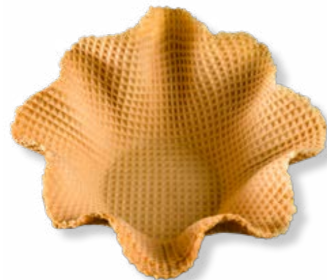
TULIPA REF. 77