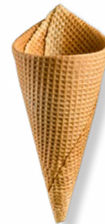
BARQUILLO ARTESANO AMERICANO Nº70 REF. 270

REF. 270: Envase: Bandeja/caja. Altura: 175 mm. Diámetro: 70 mm. Unidades por caja: 235. CAJAS POR PALÉ: 32 CADUCIDAD: 18 meses.