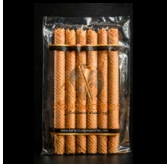
CANELA ARTESANA REF. 75