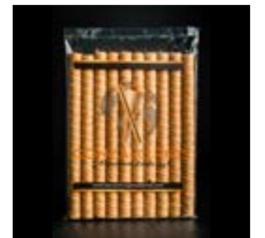
ROLLITO LARGO REF. 91

Envase: Paquetes de 10 unidades. Paquetes por caja: 35. CAJAS POR PALÉ: 60 CADUCIDAD: 18 meses.